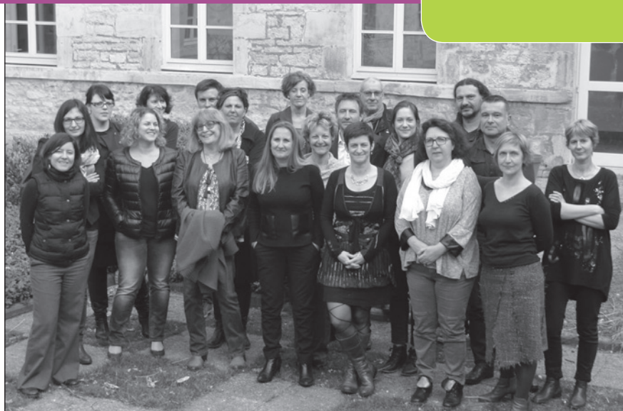
le groupe ressource

Un groupe Ressource composé d'une vingtaine de personnes d'horizons différents - Opcv, branches professionnelles, centre de ressources, institutionnels, partenaires sociaux - se réunira quatre fois par an, de 2016 à 2018.